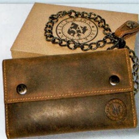
Biker-Börse Old Brandy, 69,90 Euro.

Das Leder der Börse wurde mit Spezialwachs behandelt, um den nostalgischen Vintage-Look zu erzeugen. Highlight ist die